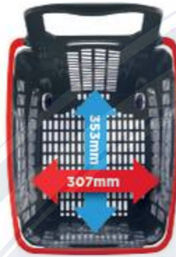
Base amplia y plana (sin resaltes) Wide, flat base (No protruding edges)