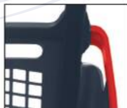
Seguridad en los Calados: Cantos Redondeados sin Aristas vivas cortantes Safe open part: Rounded edges No sharp cutting edges!!