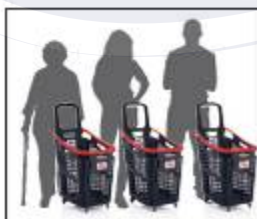
Adaptado a usuarios de todas las alturas. Can be used by shoppers of all heights.