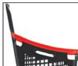
Embebadura rebajada para una cómoda carga y descarga, y un fácil apilamiento Lowered top for convenient loading and unloading and easy stacking.