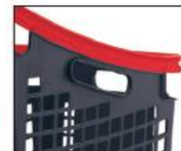
Asideros laterales. Side grips.